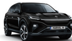
● Pebble Black (en option gratuite)