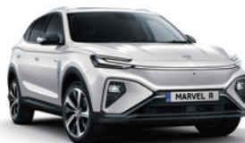
● Pearl White (en option gratuite) (4)