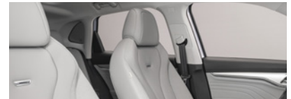
Intérieur gris : sièges partiellement en cuir Bader (en option gratuite)