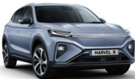
● Prism Blue (de série)