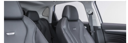
Intérieur noir : sièges partiellement en cuir Bader