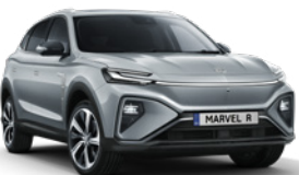
● Beton Grey (en option gratuite)