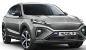
● Night Watch Grey (en option gratuite)