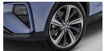
Jantes en alliage 19" - Luxury/Performance