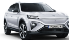
● Cumulus White (en option gratuite)